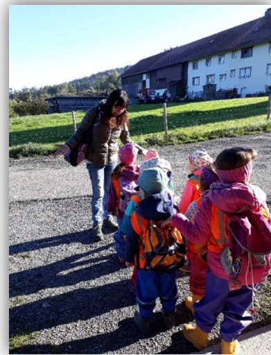
Abbildung 8 (Spettel, Pädagogin, 2022)

Wie ein/e Pädagoge/in im Kindergarten mit den Kindern arbeitet, wird maßgeblich von der Sicht auf das Kind bzw. durch das Bild vom Kind beeinflusst. Wir machen uns, bevor wir mit unserer Arbeit beginnen, jeden Tag aufs Neue, bewusst, dass jedes Kind, auch wenn es gleich alt wie andere sein mag, doch ein anderes Entwicklungstempo, andere Interessen, Begabungen und vor allem andere Bedürfnisse hat. Durch stetige Beobachtung der Kinder und die daraus folgende pädagogisch- methodische Planung, gehen wir bestmöglich darauf ein. Ein Kind soll von unserer Arbeit, der Vorbereitung und unserer Haltung ihm gegenüber, profitieren! Unsere Rolle ist Vorbild (bezogen auf das Verhalten in der Gesellschaft, die Sprache, uvm.) für das Kind zu sein und ihm die Chancen zu ermöglichen, die es für die und in der „Zeit zum Wachsen“ braucht. Wir legen einen der wichtigen Grundsteine, damit die Kinder einen guten Zugang zu und positive Ersterfahrungen mit Bildung erhalten. Gleichzeitig bauen wir mit dem Kind und anders herum eine Bindung auf. Dadurch kann ein Gefühl von Sicherheit und Vertrauen entstehen, welches das Lernverhalten, den Mut zur Neugier und die Freude am Lernen bestärkt. Jede/r, in unserer Einrichtung arbeitende Pädagoge/in und Mitarbeiter/in, ist zur Verschwiegenheit verpflichtet.