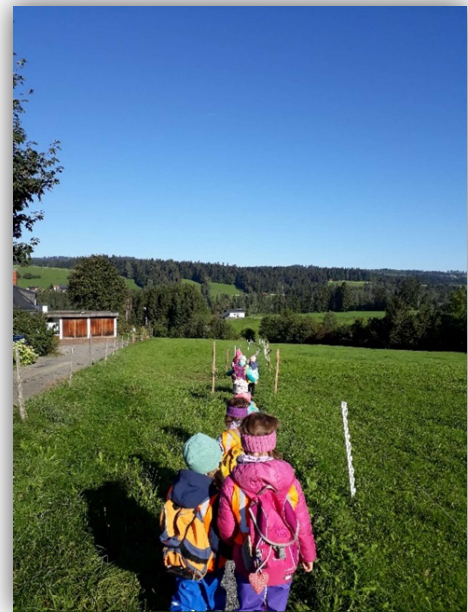
Abbildung 7 (Spettel, Kinder, 2022)

Kinder erkunden ständig und immer fortlaufend ihre Umwelt und Umgebung und nehmen dadurch mit allen Sinnen ihre ganze Welt wahr. Sie lernen durch ihre eigene intrinsische Motivation und Neugier und probieren immer wieder etwas aus, bis sie es (er-)fassen und (be-)greifen. Sie sehen all das, was ihnen ermöglicht wird – die Vielfalt an Optionen und die unterschiedlichsten Chancen und nutzen diese, um ihre Fähigkeiten und Fertigkeiten zu erproben aber auch, um diese weiterzubilden. Sie gehen von sich aus mit einer Leichtigkeit und einem Interesse an Dinge heran, weil sie innerlich genau wissen, was sie können und auch, weil sie von sich aus Neues erlernen möchten und dazu auch das Selbstvertrauen haben.