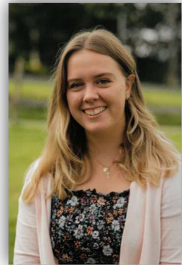
Abbildung 3