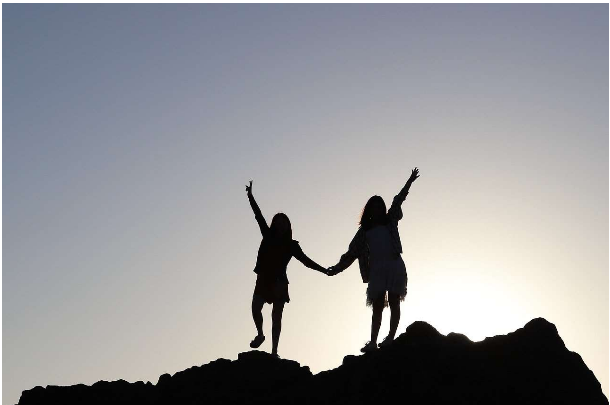
Abbildung 6 (Persblik, o.J. Verfügbar unter: https://pixabay.com/de/photos/gegen-licht-sommer-silhouette-7572922/ )

Quelle: (Lindgren/Pyczak. 2024. https://www.strategisches-storytelling.de/10-zitate-von-pippi-langstrumpf/ )