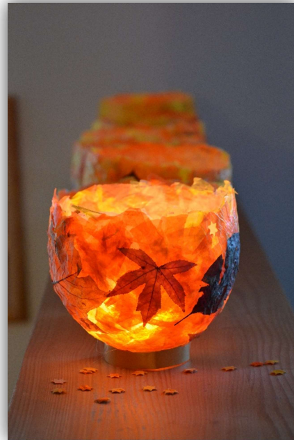
Abbildung 9 (Spettel, Martinslaternen, 2022)

Diese Feste werden bei uns mit einer kleinen Feier oder auch einer größeren Feier (bei dieser werden z.B. auch die Familie eingeladen) abgehalten.