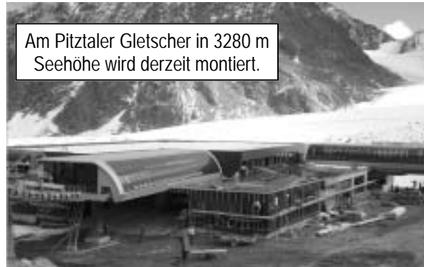
Am Pitztaler Gletscher in 3280 m Seehöhe wird derzeit montiert.