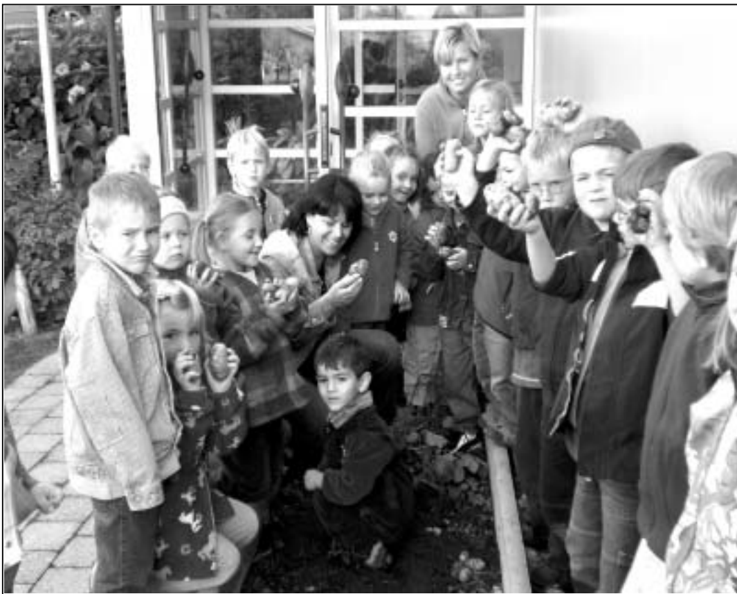
Erntezeit. Die Kindergartenkinder staunen über die Knollen, die da über den Sommer im Kartoffelbeet gewachsen sind.