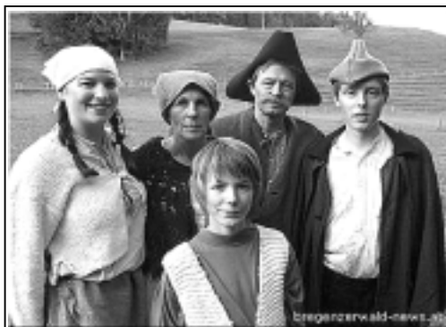
Mit Schauspielern vom Theater6934 wurde das Video über die Sulzberger Sage vom Schluchehund am "Originalschauplatz" gedreht.

Am 30.12.2006 werden sie ihre neue CD mit dem verheißungsvollen Titel „JO“ (es ist die Antwort auf den Titel der letzten CD „Wälder, wollt ihr ewig singen“) und den Film im Laurenzisaal in Sulzberg präsentieren.