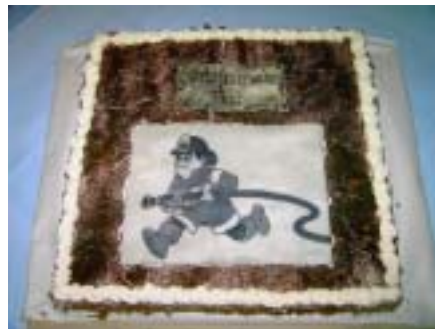
Kuchen von Günther als „Ausstand“

24.02.2007 Der Funken musste wegen der schlechten Witterung abgesagt werden.