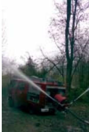
Pumpentest bei Knill Rotach

Vögel Gerd hat ein Batterieladegerät eingebaut. Seit dem kann die TS jederzeit gestartet werden. Bei den Probefahrten mit dem Auto, muss die TS auch in Betrieb genommen werden. Die TS hatte am 31.12.07 129 Betriebsstunden.