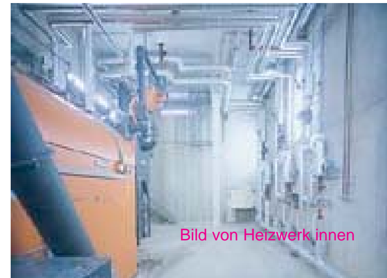
Bild von Heizwerk innen

Damit eine optimale Versorgungssicherheit gegenüber dem Kunden gewährleistet werden kann, und um die Spitzenlast abzudecken, wurde ein Ölbrenner installiert, der jedoch ebenfalls mit einem nachwachsendem Rohstoff, sprich: Biodiesel, versorgt wird.