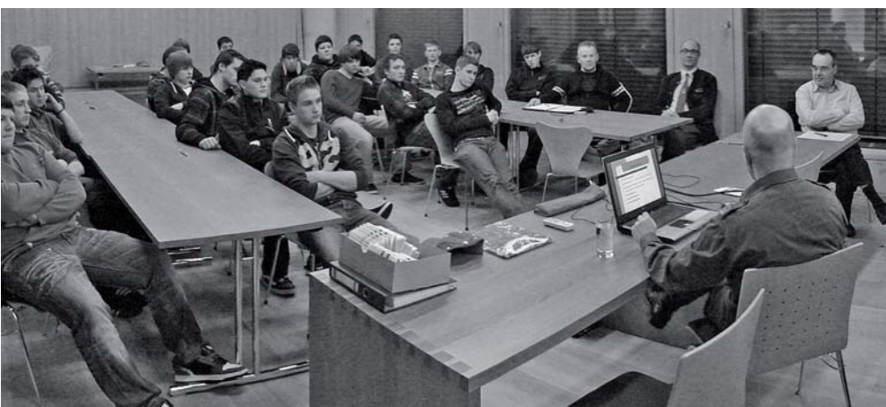
Viele Stellungspflichtige folgten der Einladung von Kameradschaftsbund, Militärkommando und Gemeinde zu einer Information und Beratung über die Möglichkeiten, die der Wehrdienst beim Bundesheer bietet.