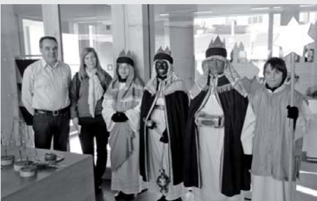
Königlicher Besuch im Gemeindeamt.