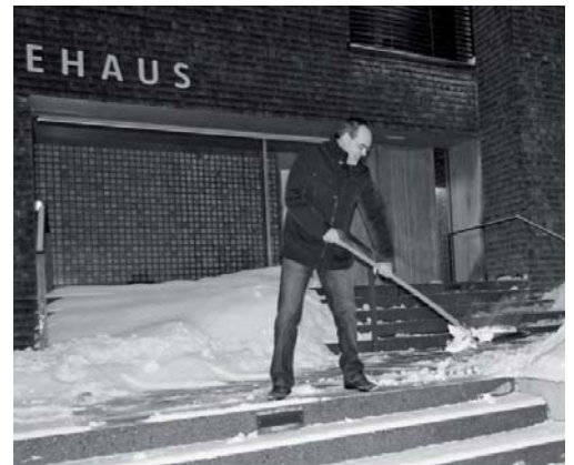
Bei abendlichen Sitzungen legt der Gemeindefeher auch mal selbst Hand an um den Weg für die Gemeindevertretung freizuräumen. Das kann durchaus zweideutig verstanden werden.