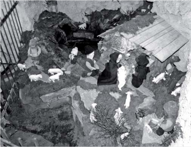
Kerzenschein, Wasserplätschern, „Stille Nacht - Heilige Nacht“. Die Krippe in der Grotte der Falzkapelle ist ein besonderer Ort der Ruhe und Kraft und magischer Anziehungspunkt für viele Menschen.