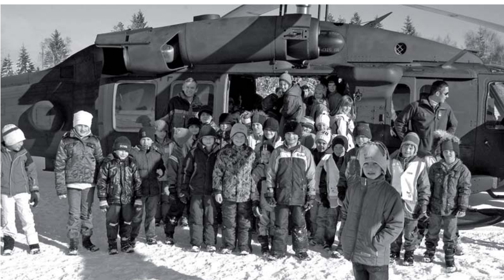
Begeisterung bei den Volksschülern für die Black Hawk. Der größte Hubschrauber des Bundesheeres landete mit Journalisten an Bord im Rahmen des Luftraumüberwachungseinsatzes am Fussballplatz.