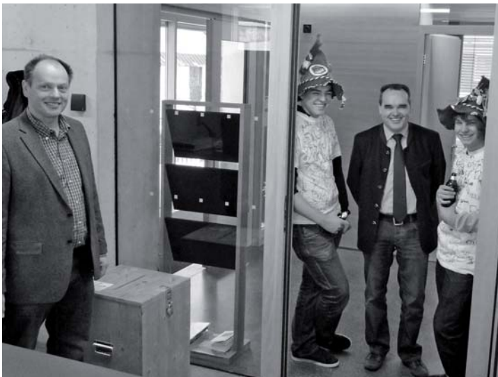
Gesellige „Wahlbeobachter“ mit heiserer Stimme stellten sich am Sonntag Vormittag im Vorwahl-Lokal im Gemeindehaus ein. Schön, dass auch die „Mustererbuaba“ trotz durchzechter Nacht fast vollständig zur Vorwahl kamen.