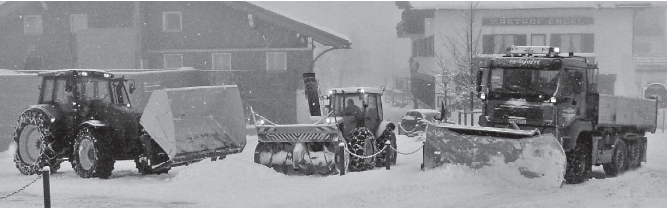
Schnappschuss am 21. Jänner: Neben diesen drei „Giganten“ sorgen weitere 20 Schneeräumungsbeauftragte in unserer Gemeinde für Schlagkraft in Sachen Schneeräumung.