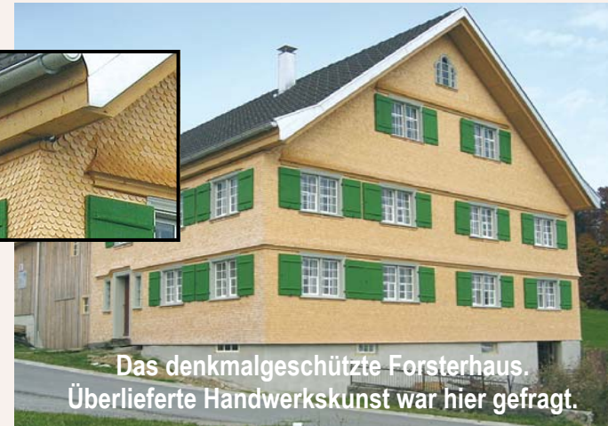
Das denkmalgeschützte Forsterhaus. Überlieferte Handwerkskunst war hier gefragt.