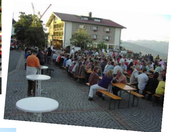
Gipfeltreff Sulzberg 10.07.08